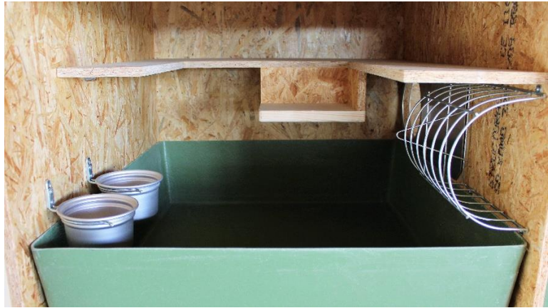
Einige Beispiele der beliebig ausgebauten Ställe mit Individuellem Innenausbau und Unterbauten.